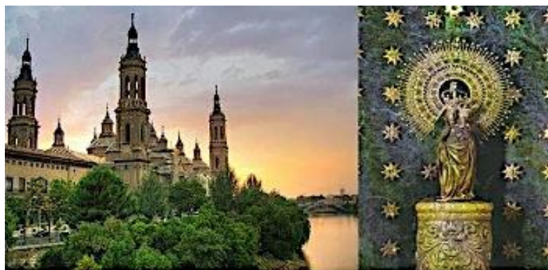
Shrine of Our Lady of the Pillar in Saragossa, Spain