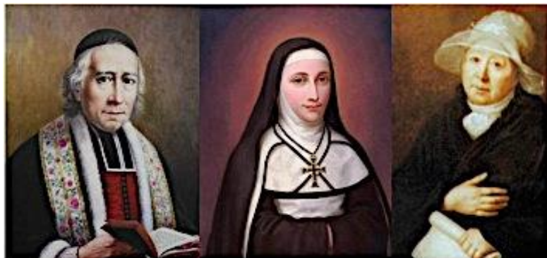
Blessed William Joseph Chaminade